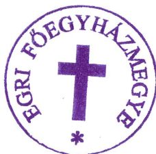
Ficzek László általános helynök